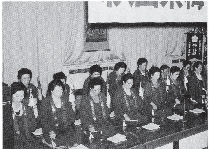
昭和63年の奉詠大会での登壇奉詠