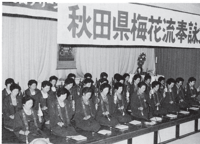
昨年の奉詠大会での登壇奉詠

正月は観音講、三月は涅槃会、彼岸会、八 月は施食会、九月の彼岸会、師走は成道会等 に参席奉詠。特に成道会は奉詠後、講員の親