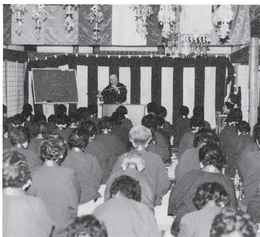
講員一泊研修会 於 太平寺

両会場共、教階により五の分科会に分かれてそれぞれの講師より指導を受けました。この研修会では、お唱えだけではなく講話や坐禅、それに朝昼晩の勤行、精進料理による食事作法などもあり、「梅花講禅のつどい」と